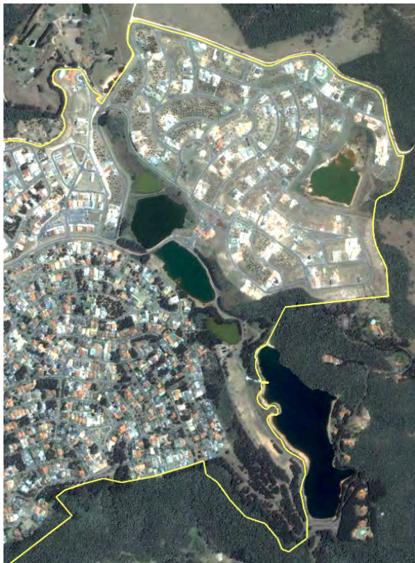
Figura 3. Composição do cenário Consolidação, onde a Morada dos Lagos conta com suas primeiras edificações. Embora aprovado anteriormente, o Residencial Lago Orion ainda não apresenta nenhuma.

b) Prossegue o adensamento paulatino das edificações nos lotes privados, convergindo para os Residenciais Lago Orion e Morada dos Lagos, que ainda permanecem com as menores taxas de ocupação, especialmente o primeiro.