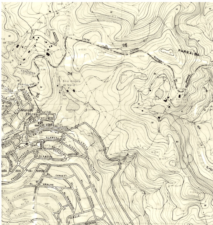
Figura 2. Composição do cenário Implantação, com a gleba onde se instalariam os Residenciais Lago Orion e Morada dos Lagos ainda vazias.

a) Aquisição sucessiva de glebas rurais no platô da serra do Itaquí pela Construtora, iniciada em 1980 6 .