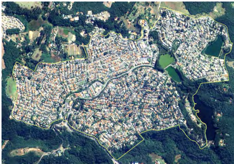
Figura 4. Área Diretamente Afetada | ADA, correspondente ao Núcleo Urbano consolidado de Aldeia da Serra.

Na perspectiva espaço-temporal, a ADA equivale ao atual Núcleo Urbano de Aldeia da Serra. É o espaço geográfico onde efetivamente se implantou o empreendimento, com todas as intervenções previstas em cada projeto de loteamento. É nela que ocorreram os impactos diretos como, por exemplo, as grandes movimentações de solo e o manejo da rede de drenagem, que exigiram medidas mitigatórias e compensatórias atreladas ao processo de licenciamento ambiental ( Figura 4 ).