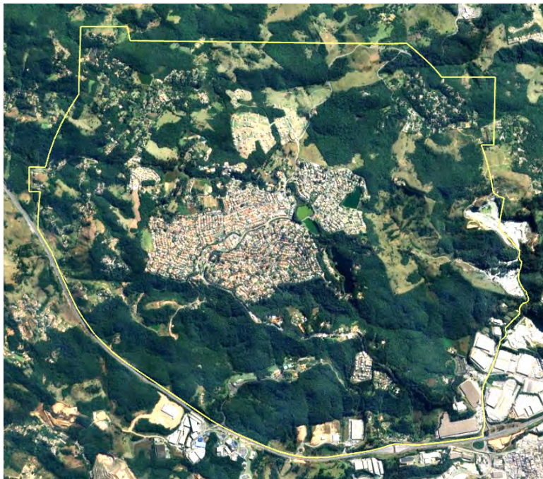
Figura 5. Área de Influência Direta / AID, correspondente ao Complexo Urbano de Aldeia da Serra.

b) processos socioambientais: têm a ver com fatores geográficos do meio antrópico (formas de uso e ocupação, inclusive a urbanização).