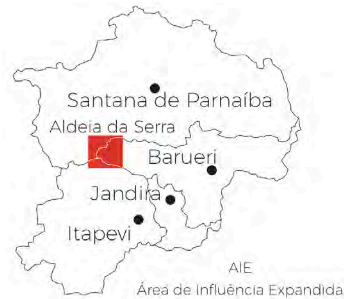
Figura 6: Área de Influência Expandida / AIE, formada pelos municípios de Barueri, Santana de Parnaíba, Itapevi e Jandira. Organização: JLMorais, 2025.

Na perspectiva do espaço geográfico, a AIE engloba os territórios de instituições, empreendimentos e demais iniciativas distribuídas pelos municípios de Barueri, Santana de Parnaíba, Itapevi e Jandira ( Figura 6 ).